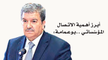
أبرز أهمية الاتصال المؤسستاتي .. بوعصامة:

أكد وزير الدولة عميد جامع الجزائر الشيخ المأمون القاسمي عقب توقيع اتفاقية إنشاء برنامج "كرسي الأمير عبد القادر"، بمركز "أكسفورد" للدراسات الإسلامية في بلندن، أن إطلاق هذا الكرسي يضيف صفحة جديدة إلى سجل طويل من التفاعل بين الجزائر والمملكة المتحدة، مشيرا إلى أن هذا التفاعل عرف محطات سياسية وعلمية وثقافية متعددة عبر القرون، ويتجدد اليوم في صورة شراكات معرفية تجعل من الجامعة والبحث العلمي جسرا للتقارب بين الأمم". وأوضح الشيخ المأمون القاسمي، أن الجزائر تنظر إلى مشروع الكرسي، باعتباره استثمارا في المستقبل واستثمارا في المعرفة، وتعربا بالصوره الحضارية للأمم الجزائرية، إذ إن الرؤية التي تتبناها الجزائر اليوم، تقوم على تعزيز حضورها الثقافي والعلمي في الفضاء الدولي، وتجدد في مثل هذه المبادرات تجسيدا عمليا لمعنى الشراكة القائمة على المعرفة، والحوار، والتعاون بين الشعوب". وذكر بأن "الأمير عبد القادر في الوعي الجزائري أكبر من مجرد رجل من شخصيات التاريخ الوطني، وإنما أحد المؤسسين الكبار للفكر الجزائري الحديث، وأحد الرموز التي تبلورت حولها معاني الدولة والشريعة والوحدة والانتما، لافتا إلى أنه واجه "طرقا تاريخيا بالغ التعقيد، حيث كان عليه أن يصون هوية مجتمع مهدد في وجوده، وأن يؤسس في الوقت نفسه نظاما سياسيا وإداريا قادرا على الاستمرار". من هنا تبرز، حسب الشيخ المأمون القاسمي، تجربته فريدة.. إذ لم ينشغل فقط بالجهاد وقيادة