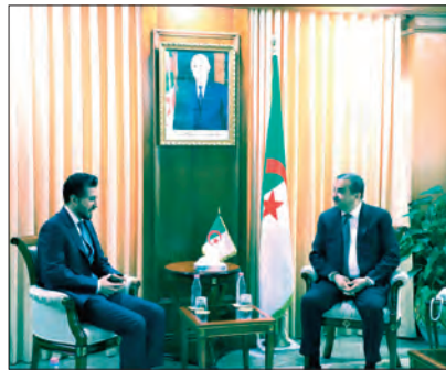
معرض الجزائر الدولي يفتتح اليوم وإسبانيا ضيف شرف

وأبرز الطرفان خلال اللقاء أهمية هذا المشروع الذي يشكل أحد المشاريع الاستراتيجية في مجال استكشاف واستغلال المحرقات في الجزائر، ويعكس الدينامية الإيجابية للشراكة القائمة بين الجانبين، مع استعراض التحضيرات الخاصة بدخول هذا العقد حيز التنفيذ، بما في ذلك الجوانب التقنية والتنظيمية المرتبطة ببرنامج الأشغال، مع التأكيد على أهمية الالتزام بالأجوال المحددة والمعايير