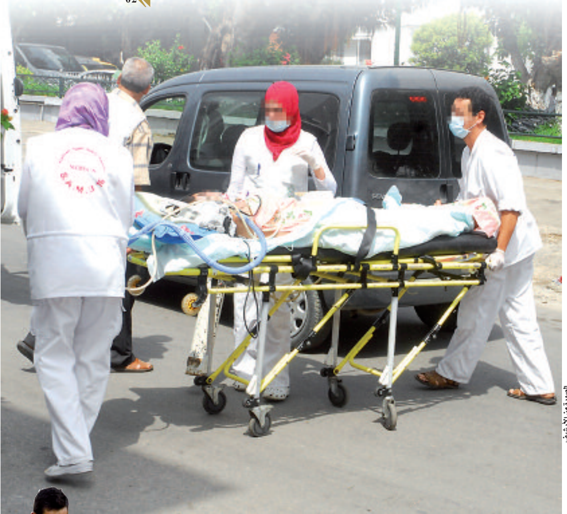
الصورة من الأرشيف