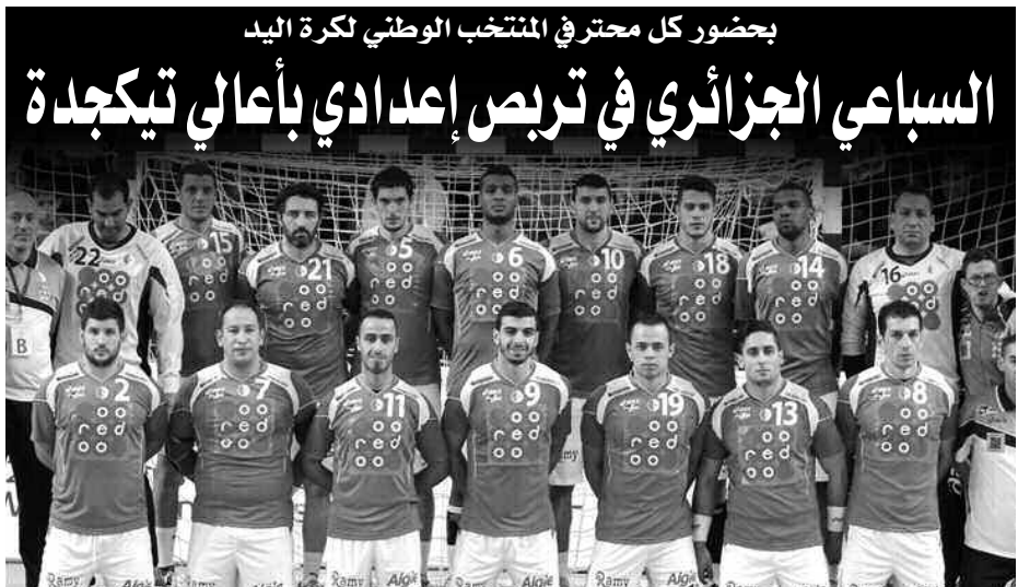
استأنف المنتخب الوطني لكرة اليد رجال، سلسلة تحضيراته للبطولة الـ 24 من البطولة العالمية، المقررة بالعاصمة القطرية الدوحة من 15 جانفي إلى 1 فيفري المقبل، بأعالي تيكجدة منذ أول أمس، ويستمر إلى غاية 11 ديسمبر الجاري، حسبما أكد بيان الاتحادية الجزائرية للفرع.