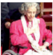
الملكة فايولا وزوجها الملك بودوان

في قصر ستويسينغ في بروكسل. وتجنسد الملكة الراحلة دونا فايولا دي مورا أي أرغون الولودة في 11 جوان 1928 في مدريد، من عائلة إسبانية من النبلاء، وتزوجت الملكة في 1960. ولم تظهر الملكة فايولا كثيرا بعد الفوارة المناجزة لزوجها الملك بودوان في 31 جويلية عام 1993، وبقيت تعيش في ظل الملكة الراحلة وزوجتها الملكة فايولا (و.أ.ج)