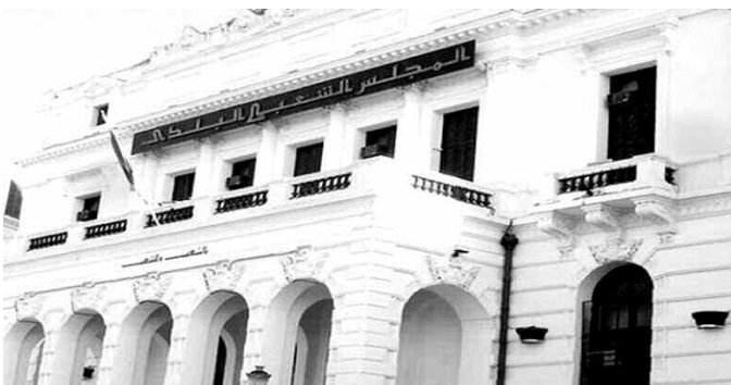
منها يتظاهره قسنطينة.

حيث قامت مصالح الولاية بتبسيو جميع الإجراءات الإدارية المتخذة، والتي من المفترض أن تتولى مصالح البلدية الإشراف على المشروع.