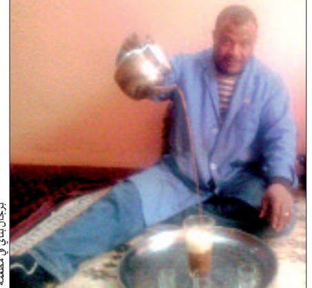
برجال بناني في مطعمه

هذين الصنفين من الطعام (دشيشة أو مختومة)، "فتحن لا نمل هاتين الأكلتين أبدا"، على رأي مواطن ورقلي لثقته "المساء" بمطعم برجال، مؤكدا أنه يعمل بعيدا، ويقصد هذا المطعم بأطراف المدينة فقط ليستمتع بطعم المختومة الورقلية.