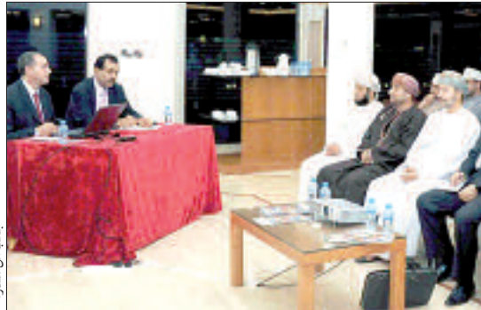
جانب من الندوة

المادي الذي تحرص خلاله كل بلد على تأمين الصحة والماء وكل ما يلزم المواطنين، وهناك على القيم وأمن الهوية وتعرض خلاله الدول على تأمين لغاتها الوطنية بالقرار السياسي والفعل الثقافي والأدب والدين والتربية والقوانين، مشيراً إلى أن كل بلد يسعى إلى وضع لغته في مأمن من تأثير اللغات القاتلة الأخرى. واستعرض الباحث آراء بعض الخبراء الذين يؤكدون على أن أفضل وسيلة لقتل لغة في بلد ما هي تعليم لغة أخرى، لذلك يطلق على اللغة الإنجليزية "قاتلة اللغات"، لأنها ابتليت الكثير من اللغات الأخرى.