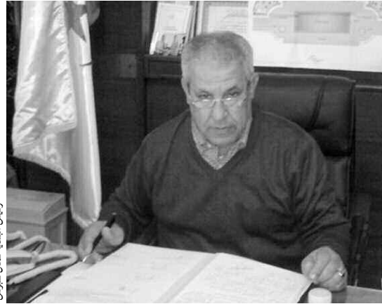
رئيس البلدية كمال طوبوش