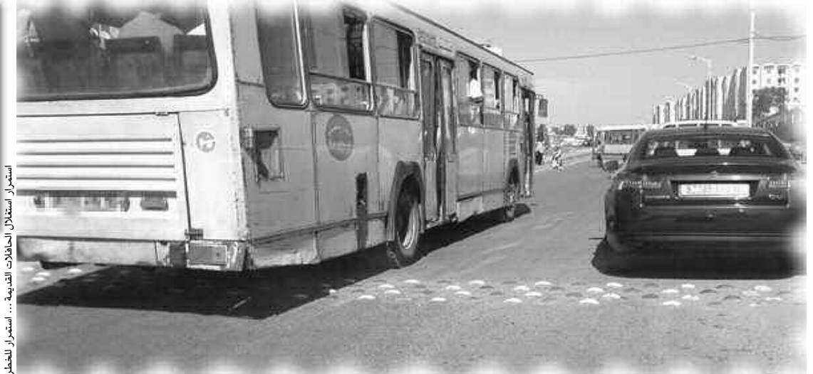
استمرار استغلال الحافلات القديمة...

على حياة الركاب، بسبب تآكل هيكلها وتلويثها للبيئة، إلى جانب الغازات الممتعة منها، رغم الدعوات المتكررة لوزارة النقل من أجل سحبها من الخدمة، ولا تزال هذه الحافلات تضمن خدمة متردية للنقل العمومي للمسافرين، وسط انتقاد الركاب الذين لا يزالون يتسارعون عن استمرار مثل هذه المركبات التي يصنفونها بـ«الخردة» في الخدمة، خاصة أن الأمر يتعلق بالعاصمة، وتنتشر هذه الحافلات بشكل واسع بمحطتي 02 ماي 1962 و «تافورة» بوسط العاصمة ومحطة «بومعطي» بالحراش، حيث تضم المحطة الأولى حافلات قديمة ومتهترقة تعود إلى سنوات الثمانينيات والتسعينيات، لاسيما المشتغلة بخط «الجزائر-الأربعاء» براقاي-الكاليتوس وتلك المتوجهة إلى «السمكة»، فيما تحوي محطة «تافورة» غالبية هذه الحافلات المتهترقة، لاسيما تلك المشتغلة بخط عين طابية - تافورة والشرقية واسطاوالي... وغيرها، بينما تشغل بمحطة «بومعطي» هي الأخرى حافلات قديمة بوجه الكاليتوس والسمكة.