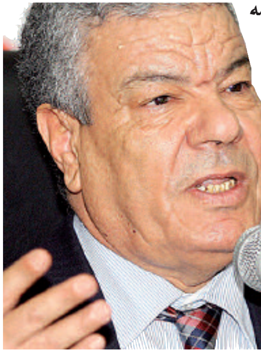
● محمد ب.

كسب الأمين العام لحزب جبهة التحرير الوطني عمار سعداني، رهان السيطرة على الهيئات التشريعية الوطنية والمحلية بظفر حزمه على 23 مقعدا في انتظار عودة المتمردين الثلاثة إلى أحضان الحزب في انتخابات التجديد النصفي لمجلس الأمة. متفوقا بذلك مرة أخرى على خصومه من "المصححين" والمتمردين عن الحزب، ومسترجعا حصة الأغلبية في انتخابات غرفة "الشيوخ" التي كان قد خسرها سابقا (عبد العزيز بلخادم) أمام الغريم التجمع الوطني الديمقراطي في انتخابات المجلس لسنة 2012.