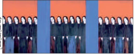
لوحة الفنان جمال طاطاح

ولد طاطاح سنة 1959 قرب سانت شامون لالوار بفرنسا من أبوين جزائريين. التحق بمدرسة الفنون الجميلة بـ "دي سانت تيان" سنة 1981 حتى 86، ثم انتقل إلى مارسيليا ليلعب بها حتى 94، أين اختار طريقه وأسلوبه الفني الخاص وانطلق في إنجاز لوحات من الحجم الكبير تمثل أشكالا بشرية في مساحات هندسية ملونة. استقر بباريس ونظم أول معرض كبير له سنة 1999، ليواصل معارضة الفريدي والجماعية في أوروبا وأمريكا. وهكذا اختيرت بعض أعماله لتكون ضمن مجموعات محتويات أكبر المتاحف، كمتحف "سالامانكا" بإسبانيا، متحف "فرونوبل"، متحف "كانتون" باليمن وغيرها من متاحف إيطاليا وألمانيا. حاليا يدرس هذا الفنان في المدرسة الوطنية العليا للفنون الجميلة بباريس، وذلك منذ 2008. من بين ما عرضه طاطاح: "صورة ذاتية في المصورة" أنجزها سنة 86 بتقنية الزيت على القماش بألوان داكنة تبرز إنسانا ينظر بحسرة وخصوصيات معينة.