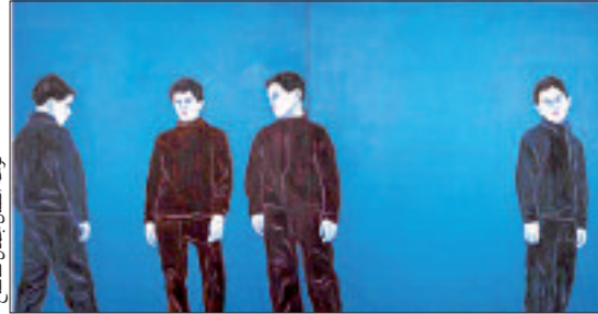
لوحة الفنان جمال طاطاح