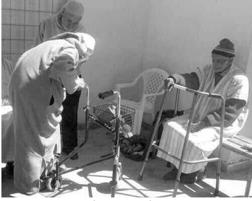
افتتحت جمعية «الكلمة للثقافة والإعلام» موسما الشقاقي لسنة 2013-2014، بمسابقة تدعمها جائزة «لقبش» للشعر الجزائري، تحمل عنوان «حوارات تحت أقدمهم»، مذكرة بأن الجنة تحت أقدام الأمهات.

والأهم من هذا، أن تقوم تلك الأعمال على تسهيل لغة بسيطة وسلسلة للحوار بناء على المعلومات وليس على البلاغة الأدبية، وأن يكتب الحوار بأسلوب لغوي جميل مشوق، من خلال مفاجآت الأحداث، طرافتها وبساطتها العميقة، وحيدا لو تتخلله كلمات وأغنيات، أمثال وحكايات شعبية قصيرة ترويحيا للوالدة. وتشرف لجنة تحكيم (من ثلاثة أعضاء) تختارهم إدارة الجائزة من مبدعي القصة والرواية على اختيار الحوارات الفائزة، إضافة إلى اختيار 22 حوارا، ويُقام حفل توزيع الجوائز ويبيع الكتاب في عيد الأم خلال شهر ماي 2014. من جهة أخرى، ترصد جائزة «لقبش» ثلاث جوائز لأحسن ثلاثة حوارات، حيث يحصل صاحب المركز الأول على 15 مليون سنتيم، فيما يحصل الثاني على 10 ملايين سنتيم، والثالث على 5 ملايين سنتيم. للشارة، فإن المسابقة تشترط على المشاركين فيها التنازل عن حقوقهم المادية، لأن عائدات بيع الكتاب ستكون وفقا دائما، أي تخصيص العائدات لدور المجرة والأمهات الفقيرات سواء بالصيغة النقدية أو في صور هدايا.