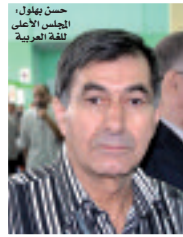
حسن بن يول، المجلس الأعلى للغة العربية