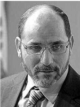
عبد الرزاق مقري

للإشارة، كان حزب جبهة التحرير الوطني قد عبّر في اجتماع لمكتبه السياسي مؤخرا، عن مساندته "المطلقة" لتوجيهات رئيس الجمهورية السيد عبد العزيز بوتفليقة، "الداعية إلى العمل من أجل