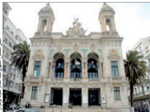
منشئ المسرح الجهوي عبد القادر علولة بوهران

مما يدفعهم إلى إنقاذها. وبعد عدة محاولات يصل الجيران إلى الحفاظ على الطبيعة ونظافة الشاطئ من جهة، وسلامة حياة الحوتة من جهة أخرى.