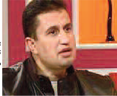
الوزير عز الدين ميهوبي