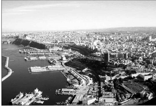
عن مواقعها حالياً.

استغل المواطنون تواجد الوالي للحديث عن مشكل انعدام المؤسسات التربوية بالحي، حيث أكد الوالي بأنه سيتم اليوم عقد لقاء برئاسة مدير التجهيزات العمومية وحضور ممثلي السكان لاختيار مواقع إنجاز مؤسسات تربوية على مستوى الحي.