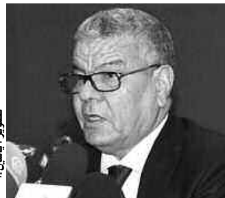
عبد العزيز بوتفليقة

يكفي أن رئاسة الجمهورية وكل عام بمناسبة الاحتفال بالفاتح نوفمبر على سبيل المثال توجه دعوات الحضور إلى كل الشخصيات الوطنية والوجوه السياسية على اختلاف انتماءاتها. ولم تترك معارضا أو مسؤولا في الدولة والمؤسسات دون توجيه الدعوة له لحضور الحفل الذي يقام بقصر الشعب. كتابة وتأكيد على أن المواقف والاختلافات والتجاذبات لا يجب أن تتحدى حدود الوطن. بوابر تهدئة الأوضاع التي وترتها عبدة سعداني على رأس الأفلان تظهر أيضا في النداء الذي وجهه الأمين العام الجديد للحزب إلى «الغاضبين والمغضوب عليهم» في الحزب من أجل العودة إلى أحضان الأسرة التي تمثلها هذه التشكيلة السياسية، المقبلة على غرار كافة التشكيلات السياسية الأخرى على موعيد انتخابية هامة في 2017. موعد يحتاج فيه الأفلان إلى خطاب الجمع والمصالحة» إذا أراد الحفاظ على أوضاعه السياسية، والحفاظ على الاستقرار والهوية التي خضم المرحلة الصعبة التي تعيشها الجزائر على