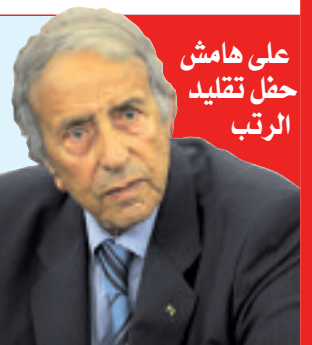
على هامش حفل تقليد الرتب

كشف المدير العام للحماية المدنية، السيد مصطفى لهبيري، أمس، عن إدماج 6 آلاف عون في دورة تكوينية بالجزائر، يشرف عليها مختصون من فرنسا، في إطار اتفاقية تعاون مشترك بين البلدين، علما أن المبادرة تهدف إلى تطوير القطاع، لاسيما في مجال تكوين وتأهيل الموارد البشرية وإعداد بروتوكول يتعلق بالمساعدة المتبادلة ميدانيا في حال وقوع كوارث. السيد لهبيري، وعلى هامش حفل تقليد الرتب الذي احتضنته القاعة الشرفية التابعة لوحدة الدار البيضاء، أكد أن التكوين يضمن الحفاظ على المكتسبات والتكفل الفعلي بالأخطار، موضعا أن هيئات الحماية المدنية لكلا البلدين تعمل من أجل ضمان نقل المهارة والخبرة بفعالية كبيرة.