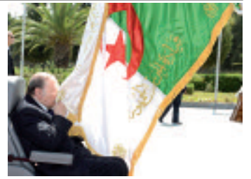
وجه رئيس الجمهورية، عبد العزيز بوتفليقة، أمس رسالة إلى الشعب الجزائري بمناسبة إحياء الذكرى الثانية والستين لاندلاع ثورة أول نوفمبر 1954. هذا نصها الكامل،

«بسم الله الرحمن الرحيم والصلاة والسلام على أشرف المرسلين وعلى آله وصحبه إلى يوم الدين