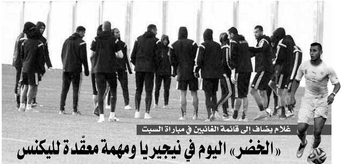
غلام يضاف إلى قائمة الغائبين في مباراة السبت