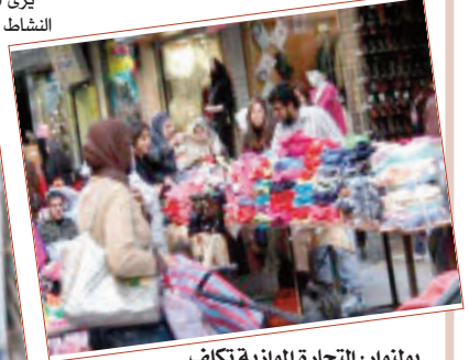
بولنوار، التجارة الموازية تكلف الخزينة 500 مليار دينار

رغم الحملات الواسعة التي شنتها السلطات المحلية على مستوى بلديات العاصمة من أجل إزالة مختلف النقاط التجارية الفوضوية، كما هو الحال بالحراش وبئر مراد رايس وبئر خادم والقبية... والتي كان محل ترحيب البعض وامتناع البعض الآخر المطالبين بالبديل، إلا أن هذه الأخيرة عرفت توقفا دون مبرر، حيث يرجع المختصون سبب ذلك إلى عدم مراقبة السلطات المعنية للأماكن المظلمة من هذا النوع من التجارة، في ظل تجاهل مطالب التجار الفوضويين باحتوائهم في أماكن مؤقتة.