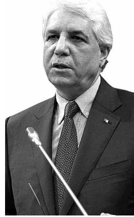
المرشح لرئاسة الجمهورية، فقد حددت بدقة ضرورة توفر المرشح لجنسية جزائرية أصيلة..

وبمقتضى هذا النص، يلتزم كل شخص مدعو لتولي مسؤولية عليا محددة ضمن هذه القائمة، بتقديم تصريح شرعي يودع لدى الرئيس الأول للمحكمة العليا، يشهد فيه بتمتعه بالجنسية الجزائرية دون سواها، وذلك خلال آجال أقصاها 6 أشهر من تاريخ نشر القانون في الجريدة الرسمية. وفي هذا الإطار، حرص وزير العدل على توضيح بأن الأحكام الخاصة بالأجال المتضمنة في مشروع هذا القانون لا تأخذ بعين الاعتبار الإجراءات التي تقع في دول أخرى بخصوص تخلي المرشح للمناصب المذكورة عن الجنسية التي كان يتمتع بها.