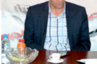
الرئيس جمال بن عبد السلام