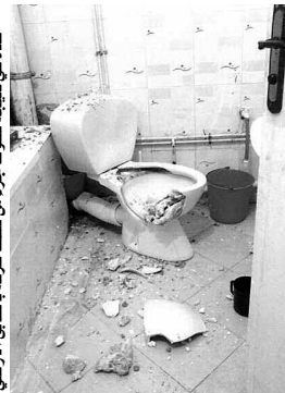
موجهة للسكن في البداية، ليتم تجهيزها واستغلالها كسكنات.

عائلات تقاضي «أوبيجيبي» بسبب خطري التلوث والتكهرب