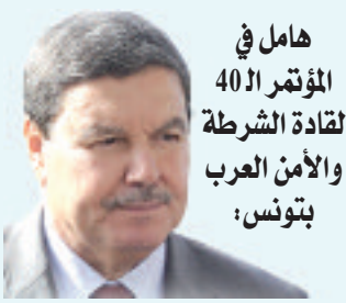
هامل في المؤتمر الـ 40 لقيادة الشرطة والأمن العرب بتونس:

الجزائر تبنت استراتيجية منسجمة في مكافحة الإرهاب