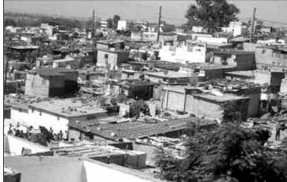
تبرمج أشغال تهيئة أخرى. ومع 50 ألف ساكن، من حقا أن تفتح بلدية لها ملاحق للخدمات العمومية.