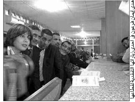
هذه هي أوضاع الفرع في إحدى زواياها المتدهورة لقطاعها