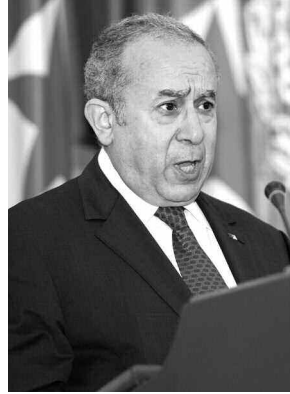
قمة ملايو أجهضت محاولات تمزيق الصفوف

في هذا الصدد حرص السيد بلاتي، على تذكير دوفراني بأن