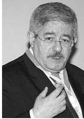
شريعة أكبر على المؤسسات.