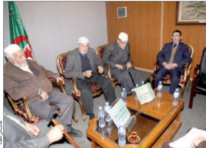
جالس من اللقاء