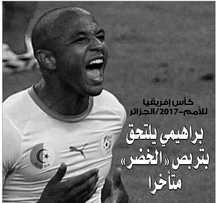
كأس إفريقيا للأمم-2017/الجزائر