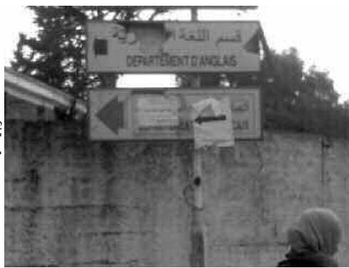
الطلبة يدرسون في ظروف صعبة.