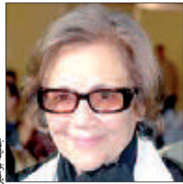
للجزائر استقلالها وشرفها. أعقبه شهادات بيوحرد التي اعتبرت أن "جميلة بوحيرد هي رمز كبير من رموز المقاومة وتناضلت من أجل بلادها وعزة

أما غسان بن جدور رئيس مجلس إدارة قناة "الميادين"، فقال: "تكريم جميلة بوحيرد ليس مجرد استعادة للتاريخ على أهميته، ولا محاكاة حاضرت نخروا فيه بقوة وبلا تكلأ في الموقف، إنما رسالة إلى جيل غدا، فندنا بيده اليوم". وحضر الحفل عدد من الطامم الوزاري في الحكومة اللبنانية، إضافة إلى فعاليات وشخصيات سياسية، ثقافية، حزبية، اجتماعية، إلى جانب كتاب، صحافيين، شعراء وأدباء من لبنان والعالم العربي، وحشد من المهتمين ومنظمي الحفل.