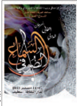
للفنون الإسلامية بعنوان: "المنمنمات والخط العربي" بهو دار الثقافة.

الفرقة الأردنية "الهاشمية للإنشاد الديني"، مرفقة بفرقتين جزائريتين وهما: "عدنا" من المسيلة و"النار" من مكيدكة. وستكون السهرة الأخيرة الختامية للمهرجان بمشاركة فرقة "فرشان" من إيران وأخرى من مصر ممثلة في محمود التهامي. في المقابل، ينظم المنظمون على هامش المهرجان، ملتقى دوليا في الفترة الممتدة بين 10 و12 ديسمبر الجاري بقاعة المحاضرات لدار الثقافة "هوازي بومدين". وفي هذا السياق، سينتظم المحاضرة الأولى "الصوفية: آفاق وعلاقات" الدكتور بن عبد ياسين، أما المحاضرة الثانية "جمالية الخطاب الشعري الصوفي، مقارنة شرح من خلال شعر محي الدين بن عربي" فسينتظمها الدكتور سعد مصالحي، في حين سيقدم المحاضرة الثالثة "الصوفية والعلاقة مع الفن عند جلال الدين الرومي"، الدكتور فيصل حسيد، كما ينظم بهذه المناسبة، معرض