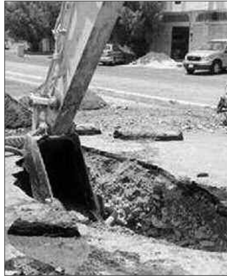
السكان أن عملية تفريغ هذه المطامير تتطلب جلب شاحنات التفريغ ودفع مبالغ مالية قد تصل إلى 2500 دج لتفريغها كل مرة،

من جانبها كشفت مصالح مديرية الري لولاية وهران، أن المشاريع المبرمجة متواصلة، حيث عرفت تأخرا بسبب طبيعة المنطقة الصخرية التي ساهمت في تأخر المشروع، إلى جانب نمو البناءات الفوضوية بالمنطقة التي تُعد من أكبر التجمعات الفوضوية بالولاية. وسيتم خلال الأسابيع المقبلة مباشرة كامل المشاريع قصد استكمالها والقضاء نهائيا على الظاهرة.