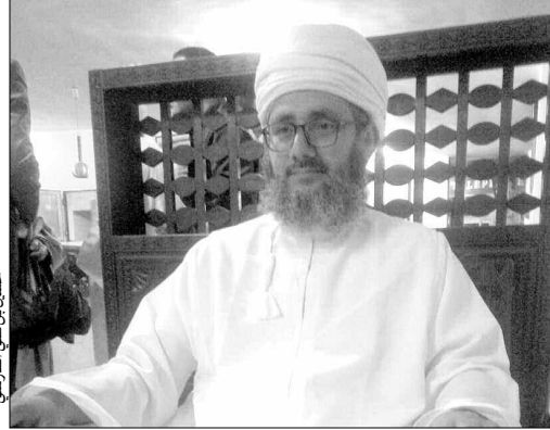
الأستاذ الدكتور العُماني حسين بن علي الفارسي

فبفعل هذا التماس المباشر مع الجزائر، اطلعنا على ثقافة بلدكم وحاولنا فهم التركيبة الجزائرية التي تجمع بين الأمازيغية والعربية وكذا الثقافة المركبة بين الثقافات الأوروبية والعربية والأمازيغية..