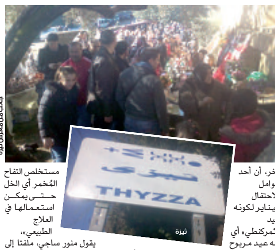
جالب من معرض ثيزة

عرفت احتفالية ينابر بقرية ثيزة، حضورا ملفتا للإعلام بمختلف قنواته، وهو ما يعكس البعد الوطني لهذا الاحتفال، ومنه كانت مشاركة جمعية الإعلاميين المتخصصين في السياحة «أقلام سياحية»،