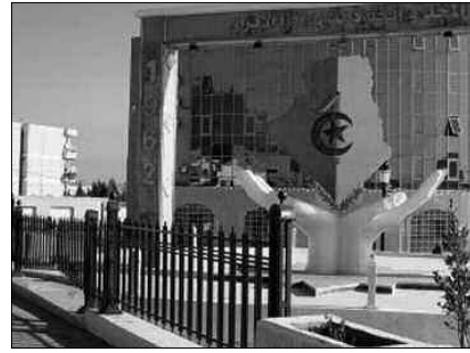
شكل مطلب كبير الفئة تضرابا في التصاريح بين واسعة من المواطنين، عرف مختلف الهيئات المعنية

بهذا الملف، أكد رؤساء البلديات على أن «الوكالة العقارية بخنشلة هي السبب في تأخر مشروع التجزئات العقارية بعد اتباعها مركزية العملية بدون إشراك المنتخبين المحليين». وطالبوا السيد والي الولاية بالتدخل العاجل لوضع حد لهذه التماطلات، وإعطاء تعليمات صارمة للوكالة العقارية من أجل تسريع عملية تجسيد مختلف التحصيلات الاجتماعية المقترحة عبر بلديات ولاية خنشلة.