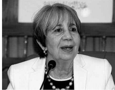
الإنساني. وتندت السيدة بن حبيلس، من جهة أخرى باستغلال العمليات التضامنية لـ أغراض حزبية» من

أكدت رئيسة الهلال الأحمر الجزائري سعيدة بن حبيلس، أمس، من أولاد هلال (جنوب غرب المدية)، أنه ينبغي على هذا الجهاز أن يشكل «ذراعا إنسانية حقيقية للدولة»، مؤكدة أن العمليات التضامنية التي تقوم بها هيئتها «حاضرة هنا من أجل مراقبة الجهود المبذولة من طرف السلطات العمومية». وأ