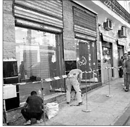
الصورة الثالثة التي تليق بالعاصمة.

المظهر الجمالي للعاصمة، وجه على إثرها 3702 إعذار، واقتراح غلق 55 محلا، بينما سجل 297 تدخلا خاصا بالتجارة الفوضوية، وتم اقتراح غلق 12 محلا و30 متابعة قضائية، فضلا عن أنشطة مرتبطة بمخالفات أخرى، التي سجلت بشأنها 1541 تدخلا، وتوجيه 101 إعذار واقتراح غلق 40 محلا و416 متابعة قضائية. وأما فيما يخص عرض المواد خارج المحل، فسجل 12515 تدخلا وتوجيه 6500 إعذار واقتراح غلق 248 محلا، أما عدد المتابعات القضائية، فبلغت 78 متابعة، وفيما يخص النظافة داخل المحلات، فسجل 6742 تدخلا، ووجه 482 إعذار، تم اقتراح 67 محلا وتحريم 1127 متابعة قضائية.