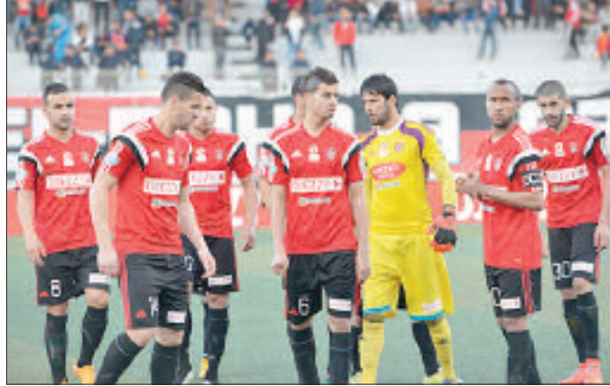
سيجمعهم السبت المقبل بمولودية الجزائر، حيث يتقاسم الفريقان المركز الثالث بـ34 نقطة بفارق 4 نقاط عن المتصدر وفاق سطيف.

عادت تشكيلة نادي اتحاد العاصمة اليوم إلى أجواء التدريبات، من أجل الاستعداد جيدا للقاءه المقبل الذي ينتظرها بميدان 5 جويلية الأولمبي، عندما يلاقون الجار والغريم. في حوار عصامي مثير لن يخلو من التشويق والمنافسة بين تشكيلة الفريقين. •و.توفيق