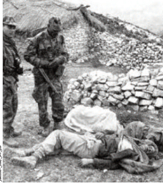
صورة من فيلم المستعمر