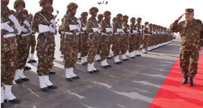
م / ب

دشن الفريق أحمد قائد صالح، نائب وزير الدفاع الوطني رئيس أركان الجيش الوطني الشعبي، أمس، بجاسي تيريرين بتمنراست، قاعدة الانتشار الجوية التي تعد إنجازا قاعديا هاما سيساهم في حفظ أمن البلاد وحماية حدودها الجنوبية. كما عاين بعين قرام وحدات القطاع العملياني ووحدات أقصى جنوب البلاد.