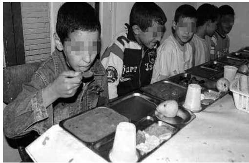
استرجاع تسيير المطاعم بالابتدائيات يحسن ظروف الإطعام

المسؤول أكد في المقابل، بأن اللجنة المختلطة نفسها رفعت مطلباً قبيل أسبوع لكل بلدية على حد العرض حال حول ما تم إنجازه بشأن خدمة الإطعام المدرسية ومتابعة الأشغال، «وبعد الحوصلة سندرس كل حالة على حدة، كما أنه لدينا غلاف مالي آخر مهم سيتم توزيعه على المدارس، خاص بالتجهيز بصفة عامة، المدافئ وتحسين المطاعم وظروف المدرس بشكل عام، لكن قررنا عدم صرف هذا المبلغ الهام إلا بعد عرض الحال ودراسة ما تم إنجازه خلال الموسم الدراسي السابق، يقول نفس المسؤول