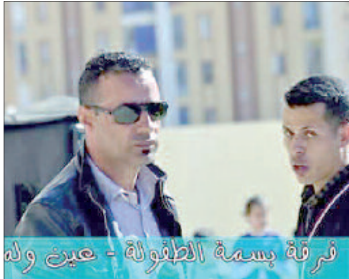
فرقة بسمة الطفولة - عين ولة

اتجه اهتمام فرقة البسمة تزامنا واقترب العطلة الربيعية، إلى التفكير في إقرار مشروع جديد يهتم الطفولة، ويتمثل في تنظيم فعالية يقوم فيها الأطفال بإحضار قصصهم التي يرغبون في تبادلها بكتب أو قصص أخرى، حيث يمكنهم اختيار قصص بديلة تناسب ذوقهم من القصص التي أحضرها غيرهم من الأطفال.