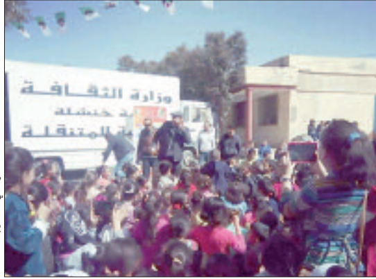
قراءة في احتفال

• سميرة عوام/ع.ز. / زايدي منى/خ. نافع/ح. شبيلة