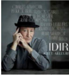
الرقيق، في أداء يشبه هؤلاء القبائليين الذين يتوجهون نحو الجبل.

يعود الفنان الكبير إيدير هذه المرة بتحد كبير، إذ أصدر في ألبومه المرتقب صدوره يوم الجمعة المقبل بفرنسا، على أن يؤدي عمالة الفن ونجوم عالميون من فرنسا، أغاني باللغة الأمازيغية، يتقدمهم المغني الكبير شارل أرنافور، وكذلك فرانسيس كابرييل، باتريك برويل، ماكسيم لوفوريستي، غرون كور مالد، برنارد لافيني و جيرارد لينورمان وهنري سالفادور بمشاركة رقيقة من ابنته ثانيا.