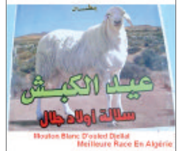
90 مرب تنافسوا على جوائز أحسن سلالة

تضمنت تظاهرة عيد الكباش مسابقة أحسن سلالة من ماشية أولاد جلال، حيث خصص المنظمون ثلاث جوائز تتعلق بأحسن كباش وأحسن نعجة وأحسن خروف، إضافة إلى جوائز أخرى تخص المواشي خارج سلالة أولاد جلال بهدف السماح لأكثر عدد ممكن من المربين والموالين بالمشاركة، والظفر بالجوائز المخصصة لهذه المسابقة. والملفت هذه السنة هو العدد الكبير من المشاركين الذين توافدوا من ولاية بسكرة بصفة خاصة، إضافة إلى عدد قليل من المربين من خارج الولاية، وهذه المسابقة التي تعد الوحيدة من نوعها وطنيا والتي تخص سلالة أولاد جلال، تهدف في الأساس - حسب منظميها - إلى تشجيع الموالين والمربين وبعث روح التنافس بينهم، من أجل تطوير السلالة الجالية المشهورة عالميا، إضافة إلى تمكين المواطنين والجمهور من الاطلاع على سلالة أولاد جلال عن قرب، حيث تمكن الجمهور ومن مختلف الأعمار، من رؤية الكباش الحقيقية ذات النوعية العالمية التي لا يراها المواطنون إلا في الأعياد، وقد مرت المنافسة بثلاث مراحل، ففي المرحلة الأولى تم فتح مجال التسجيل الرسمي للمشاركين في المسابقة لأكثر من أسبوع قبل انطلاق هذه التظاهرة، أما المرحلة الثانية، فخصصت لمعاينة المواشي المشاركة في المسابقة من خلال تعيين لجنة مشكلة من عدة أطراف لمعاينة وتقييم المشاركين وتقطيعهم، ومنه تحديد الفائزين، وهذه المرحلة كانت هذه المرة الأصعب من حيث قوة المشاركين وتقارب المستوى بين الكباش والنعام والخرفان أيضا، لتكون المرحلة الثالثة والأخيرة هي الإعلان عن الفائزين وتوزيع الهدايا والجوائز بحضور ممثل عن وزارة الفلاحة والصيد البحري، ومسؤولي الولاية والمقاطعة