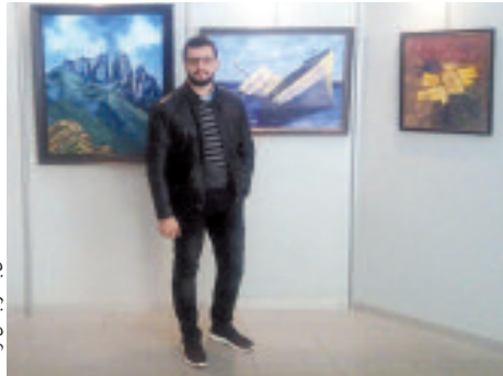
فنان جيلالي صالح في معرضه