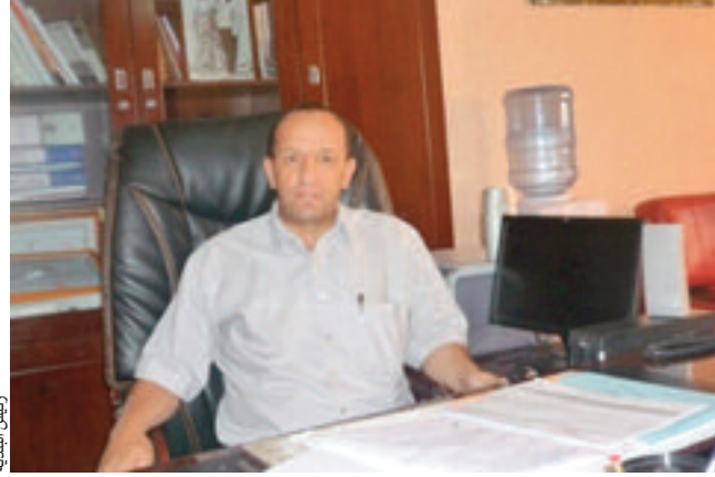
نائب الرئيس البلدية

وأضاف أن عملية الربط بالغاز الطبيعي تسير ببطء، حيث أسندت البلدية عملية إصال هذه الطاقة لمؤسستين، وتكلفت مؤسسة بربط قريتين، في حين أوكلت القرى المتبقية لمؤسسة أخرى، والتي ويسبب عجزها، تم فسح العقد معها وتعويضها بأخرى. وفيما يخص بالربط بالتيار الكهربائي لقرى أث رباح، ثاسفت، إغيل نسدة، بوعندان، إغيل بهاس وات، علاوة على أن العملية مجمدة، في حين هناك مشروع إنجاز خط ضغط متوسط بأث واسيف، سيعمل على تقوية التيار ووضع حد لمشكلة الانقطاعات المتكررة.