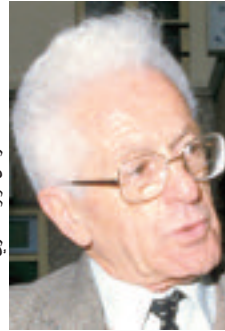
الراحل بوعلام بسايح

موحدة، بناها الجميع، ودافع عنها الجميع كل من منطلقه، جمعتهم الوطنية والانتماء إلى هذا الوطن المفقّد: فثأرا ورسميا ورواية وتاريخيا وسينما وإخراجا ولأيا وتتميّلا وسريريا... يظل التكريم الذي خص به رئيس الجمهورية رجال الفكر والثقافة والفن في بلادنا، سنة حميدة تروى أجياله بأن هؤلاء ساهموا في خدمة الجزائر وقدموا النصب الأوفر لنهضة الوطن وتعزيز مكانته في الداخل والخارج وفي العالم على هويته، وأيضا لمكانة تلك الأسماء الثقيلة وبشائنها محفورة في الذاكرة الجماعية.