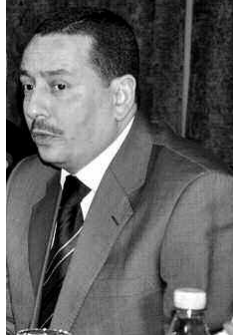
الديمقراطية وحقوقا عديدة كرسها لفائدة الشعب الجزائري..