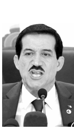
شغل لفائدة الشباب البطال. وبعدما دعا غول إلى تعزيز الأمن والتصدي للتحديات الأمنية والاقتصادية والاجتماعية، أكد وجوب الوقوف صفا واحدا لضمان

تماسك الوحدة الوطنية، مشيرا إلى أن رص الصفوف في الوقت الحالي هو واجب وطني «ضئيل» مقارنة بما قدمه شهداء الجزائر. على صعيد آخر، اقترح غول خطة جديدة للتقليص من ظاهرة البطالة تركزت على «تأطير طالبي الشغل ومرافقتهم للحصول على مناصب شغل»، مذكرا بأهمية تطوير النشاط الفلاحي من خلال تدعيم ومرافقة المزارعين والموالين للاستجابة لانشغالهم، بالإضافة إلى إمكانية استفادتهم من «قروض تشاركية من دون فوائد».