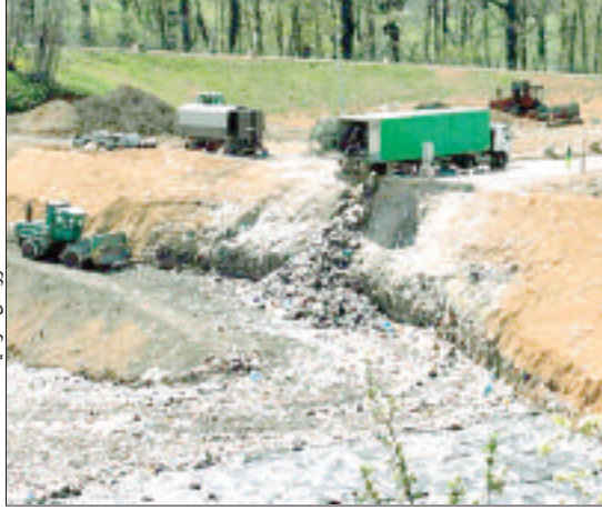
مركز الردم التقني للزعارة ببومرداس

يومية، بينما تمثل بوزقة قدرة وسوق الحد وعمال ولشاطة البلديات الأقل، بكميات تتراوح ما بين 5 و10 أطنان يوميا. كما أظهر التقرير أن من أهم أسباب تضخم كمية النفايات توسع النسيج الصناعي بالولاية في السنوات الأخيرة وتزايد الكثافة السكانية. كما يظهر فشل عدد من بلديات الولاية في تسير ملف النظافة كعامل هام زاد من تفاقم الأمر، ناهيك عن كثرة الهياكل المنتجة للنفايات، على غرار المستشفيات والأسواق الأسبوعية والمطاعم والمذابح وغيرها، وهي الأسباب والعوامل التي حدثت بالسلطات الولائية إلى إساءة تسير ملف النظافة إلى لجنة تقنية متخصصة تخصص كل مدينة كبرى، على غرار «كوفيف» لبلدية بومرداس التي تعمل وفق عدة مقاييس، وهدفا المحوري تسير عقلاني وواقعي للنفايات والمحافظة على البيئة والمجتمع، ومنه جاء التأسيس لـ «مداينات» التي انطلقت في عملها أمس الأول بحاصمة الولاية في انتظار تعميمها على كل بلديات ببومرداس.