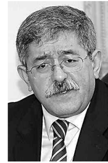
الاعتبار للثقافة وحماية الديمقراطية.

وتوقف السيد أويحيى، مطولا عند ضرورة تحسين مناخ الاستثمار، مشيراً إلى أن الوقت حان لاستكمال الإصلاحات و«إضافة الشفافية ومحاربة أسماهم»-البيوتيات، مضيفاً أن الدولة مطالبة بالاستمرار في الاستثمار العمومي لكن يجب