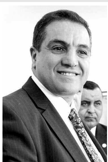
الفتية تسعى إلى إحداث تغيير حقيقي، في الجزائر، مشيرا خلال

جاء هذا خلال التجمع الشعبي الثاني الذي ينظمه خلال الحملة الانتخابية بولاية الشلف، مثمنا مجهودات المرأة التي تحدها الإرادة والعزيمة التي على أساسها وضع ثقته فيها باعتبارها حفيدة سيل من الشهداء اللواتي ضحوا من أجل هذا الوطن.