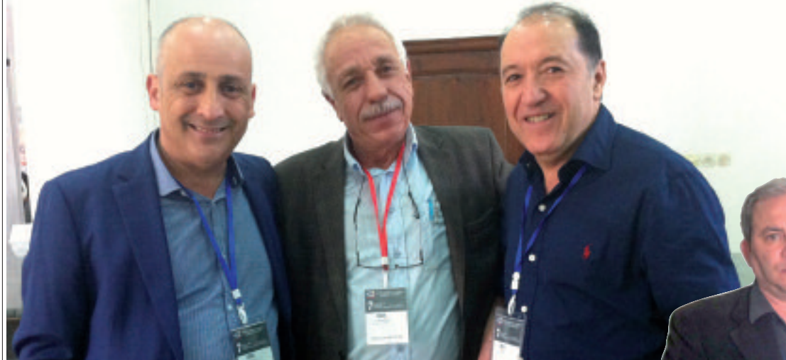
ملتقى طب التجميل

أشار الدكتور مصطفى سرير، رئيس الجمعية الوطنية لجراحة وطب التجميل، على هامش الملتقى الذي احتضنه فندق الرياض على مدار يومين، أن هذا الملتقى يدخل ضمن قائمة المؤتمرات التي تنظمها الجمعية وتعمد من خلالها إلى تعريف الأطباء بجديد الطب والتكنولوجيا وما جاد به المختصون في دول أخرى في عالم التجميل، بهدف التكوين المتواصل للأطباء الجزائريين الذين يحضرون من مختلف ولايات الوطن للاستفادة منه، مضيفاً أنه تم التطرق من خلال الملتقى إلى جديد الجراحة التجميلية في شد الوجه وترهلات الجسم بالألة، والتي تتطلب الترطيب الكلي للجسم قبل القيام بعملية الشد التي تعتبر سهلة وفعالة. كما قدم المختصون مداخلات حول التجميل بالغذاء، والعلاج بالليزر الصينية والجراحة الترميمية بعد العمليات الجراحية الخاصة بمرض السرطان، كترميم الثدي وغيرها. وقد شهدت الورشات التي نشطها المختصون وعرض من خلالها أعمالهم الترميمية التي ساعدت المرضى على الخروج من الأزمات النفسية وتحقيق الرضا عن