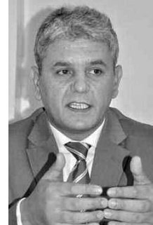
الثقافة والديمقراطية «إنشاء مناطق إقليمية تضم مجموعة هامة من البلديات ويمثلها نواب

ومن ثم الحلول أشار المسؤول الحزبي إلى الطاقات المتجددة، حيث دعا إلى «ضرورة