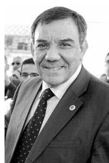
كما دعا رئيس الجبهة الوطنية الجزائرية الجميع للتجند من أجل التوجه بقوة إلى صناديق الاقتراع من أجل التصويت بقوة ضد دعاة المقاطعة والعزوف الذي لا يخدم مصلحة البلاد، مؤكدا أن الانتخاب حق لا اختيار من

وشرح المسؤول الحزبي اختيار امرأة على رأس قائمة المترشحين بيوهران ووجود قائمة مكونة كلها من النساء بالشلف، «ما تميز به تلك المترشحات وكفأتهن وشجاعتهن والتزامهن ووفائهن لخط الجبهة الوطنية الجزائرية».