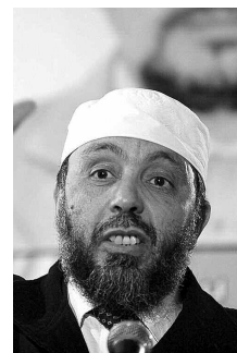
بر الأمان ولن تعرف نهوضا حضريا، داعيا إلى التغيير بالفعل لا بالقول من خلال التصويت الذي يقدم البديل الناجح خلال تشريعات ماي المقبل. رئيس جبهة العدالة والتنمية، وعشية اختتام الحملة الانتخابية، اعتبر أن أساس النهضة في أي مجتمع هو الجانب التشريعي الذي ينظم حياة

ومن باتنة أكد عبد العزيز بلعيد، أول أمس، أن تشكيلته السياسية