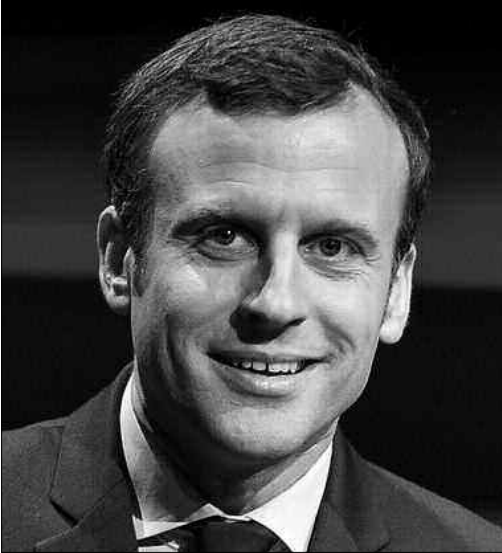
الشراكة الاقتصادية بين البلدين.

جدار البرلمان... هل يطيح بمساعي ماكرون حول الذاكرة والاقتصاد؟