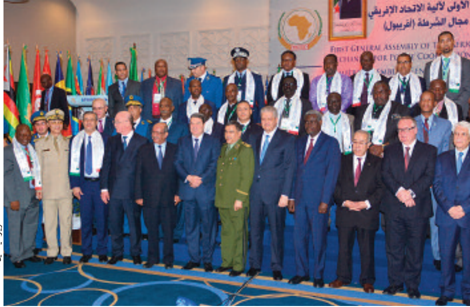
الوزير الأول عبد المالك سلال مع أعضاء اللجنة سيكفون

قمة مفوضية الاتحاد الإفريقي حول إصلاح مجلس الأمن مساهايل يمثل الرئيس بوتفليقة