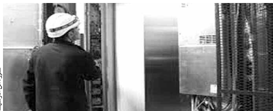
صورة من الأرشيف

جدد سكان حي ديار الجماعة ببلدية باش جراح، مطلبهم المتمثل في ضرورة إصلاح مصاعد العمارات التي لا تزال معطلة منذ فترة طويلة تجاوزت العشرين سنة، حيث أكد نقيب لـالمساء "أن عطل المصاعد الكهربائية في معظم طوابق العمارات العالية، التي قد تصل إلى 15 طابقا، قد طال أمدا، مما خلق مشاكل كبيرة أنهكت سكانها، خاصة القاطنين منهم بالطوابق العليا، بعدما كانت تسهل عليهم الوصول إلى بيوتهم، الصعود أو النزول منها بضعة يومية، إلى أن توقفت نتيجة الأعطال التي لحقت بها في ظل عدم تحرك الجهات المختصة. وتحدثت إحدى العائلات التي تقطن في العمارة رقم 5 و، عن التعب الذي يعتريهم يوميا جراء غياب المصاعد، حيث أوضحت إحدى السيدات، وهي أم لابن معاق، أنها تتحمل مشقة صعود ونزول سلام العمارة التي أرهقتها وأرهقت السكان بمختلف شرائحهم كبارا وصغارا، خاصة المسنين والمصابين بأمراض القلب، الضغط الدموي