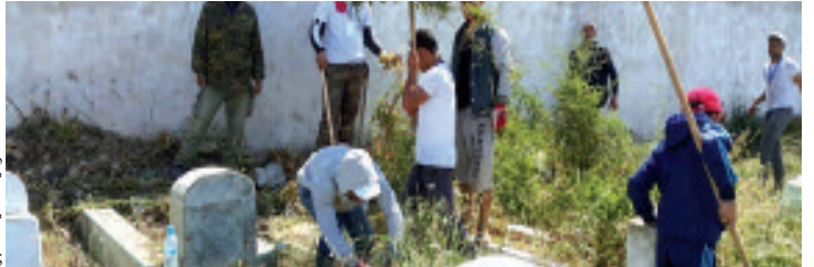
حملة تطوعية لتنظيف مقبرة

يذكر أن تحرك أفراد المجتمع المدني ببلدية بتيجلالين لنفض الغبار عن الإرث التاريخي للمنطقة، جاء بعد الاستجابة لسلطات بومرداس الولائية، سواء الوالي شخصيا أو مديرية المجاهدين، وحتى السلطات الأمنية، للعمل من أجل حفظ الذاكرة الوطنية في سبيل إعادة الاعتبار لرموز الثورة، لاسيما الهبة الكبيرة التي عرفتها مغارات جبال جراح ببلدية عمال، لاستخراج رفات وتحليلها والتأكد من أنها لشهداء الثورة، بالتالي تكريمها بإعادة دفنها في مقبرة مصنفة.