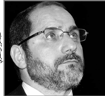
عبد الرزاق مقري

ووعّد سلال الصحفيين بالتطرق إلى القضايا المطروحة على الساحة الوطنية بشكل موسع مع نهاية الأسبوع الجاري.