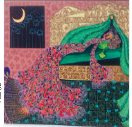
عما، الفضائنة 1

كما اعتمدت الفنانة وعلى غير عاداتها، على الخط، ففي لوحة رسمت بدمى مذكوباً فيه «فرقة نقاس»، يعود إلى أول فلوتهلا، حينما شاهدت فرقة غنائية في المدينة التي تصعد منها عائلاتها، تستعمل بندري كتب عليه ذلك، أيضاً لوحة كتب فيها «جاتي برة»، تعني بها حالة الإنسان وهو ينبت الفهد وترتقب الفرح. كما قدمت جعيدة أعمالاً رسمتها على الورق، فكانت مختلفة عن تلك التي رسمتها مباشرة على اللوحة، وهنا قالت الفنانة بأنها ترك مساحة لعملها على الورق من خلال اعتمادها على إطار كبير لرسمه صغيرة، كما أنها تجد راحتها في هذا الأسلوب، حيث