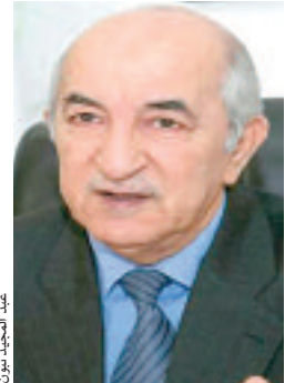
عبد المجيد تبون

المادية عن مواطني المناطق الجنوبية؛ باعتبارها تستهلك الطاقة الكهربائية بشكل كبير وطيلة فصول السنة، لاسيما في فترة الحر الشديد. فيما يتعلق بالمساهمة في ترقية الواقع الاقتصادي، فإنه سيسمح بتوسيع دائرة توفير هذه المادة الطاقوية الهامة، ووضعها في متناول شرائح واسعة من الفلاحين؛ مما سيكون لذلك تأثير مباشر على زيادة الإنتاج وتسهيل مزاولة النشاط، فضلا عن تشجيع المستثمرين الصناعيين على تجسيد مشاريعهم وتكثيف ألق.