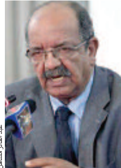
عبد القادر مساهل