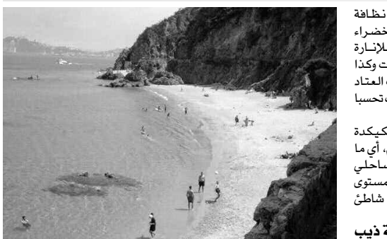
بو جمعة ذيب