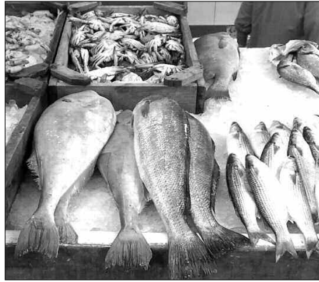
مشروع تربية الأسماك بمنطقة السبيعات ببلدية المساعيد دائرة العامرية، وهو المشروع الذي يتربع على مساحة 2000 متر

وبالموازاة، تم منح ست (6) رخص بناء لمشاريع استثمارية من نفس الحجم، بالإضافة إلى مشروع سابع يتم حاليا مناقشته من قبل اللجنة المكلفة من أجل تسوية مشكل تقني.