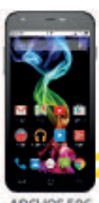
ARCHOS 50C €12 590