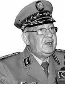
الدفاعات بهذه المؤسسة التكوينية المرموقة.