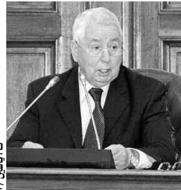
ت. ب. ب. ب.

وختتم بن صالح، حصيلته مجلس الأمة خلال الدورة البرلمانية المنقضية، بالتطرق إلى النشاط الفكري الذي يادر به مجلس الأمة في إطار ترقية الثقافة البرلمانية، مؤكدا بأن المجلس استطاع بفضل هذا النشاط الفكري أن يفرض نفسه في الساحة كملتقى ومبني لنخبة المثقفة في الجزائر.