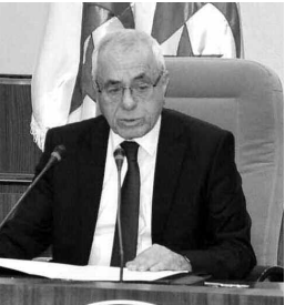
ت. ب. ب. ب.

دعا إلى الحيطة للتصدي للتهديدات التي تواجه البلاد بوحجة، تعزيز الممارسة الديمقراطية ومراقبة مخطط الحكومة