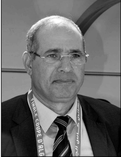
تصوير: ياسين / 1

مثلما أكد في السابق، أنهى المدرب بادو الزاكي بصفة رسمية مشواره مع شباب بلوزداد الذي توج بنيل لقب كأس الجمهورية للموسم 2017 - 2018، في أعقاب انتصار الفريق على وفاق سطيف في المباراة النهائية بنتيجة (0 - 1). ع. اسماعيل