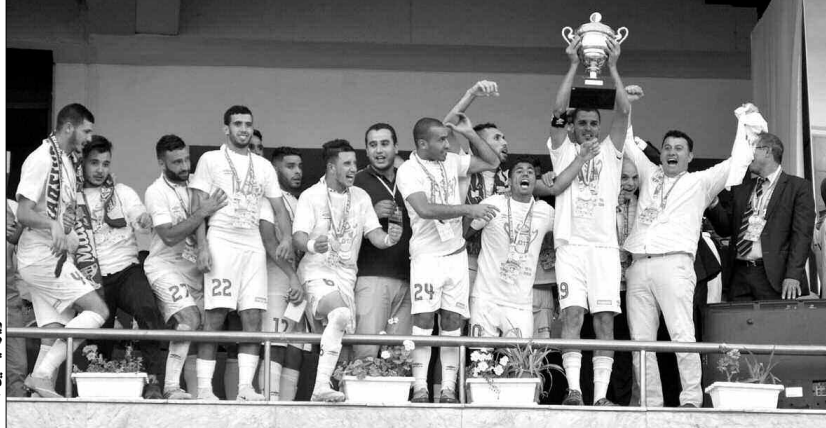
تصوير: ياسين / 1

نجح فريق شباب بلوزداد في إنهاء موسمه بامتياز، بعد أن توج بلقب كأس الجزائر لكرة القدم على حساب وفاق سطيف (1-0) بعد الشوطين الإضافيين، في نهائي جرت وقائعها يوم الأربعاء الماضي بملعب 5 جويلية الأولمبي، الذي عرف حضورا جماهيريا غفيرا. • و. توفيق